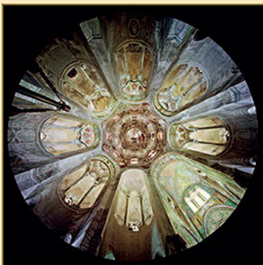
BASILICA DI SAN VITALE (RAVENNA)