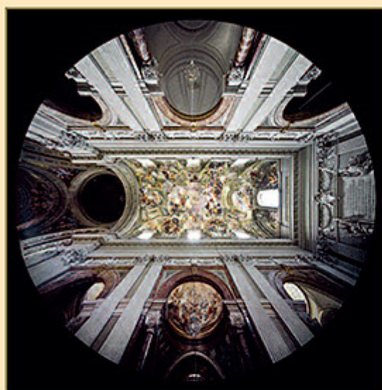
CHIESA DI SANT'IGNAZIO DI LODI (ROMA)