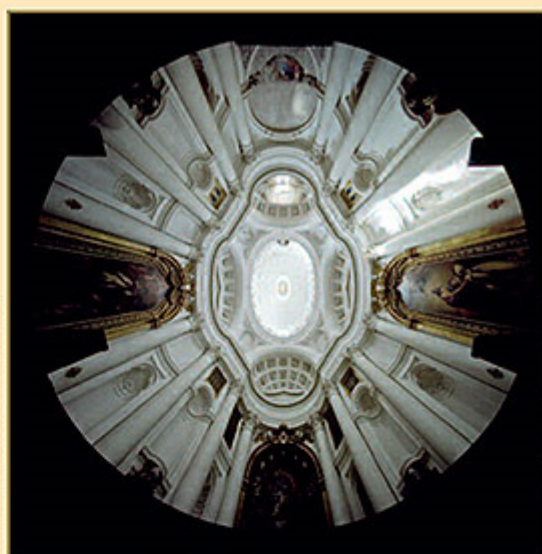
CHIESA DI SANT'IVO ALLA SAPIENZA (ROMA)