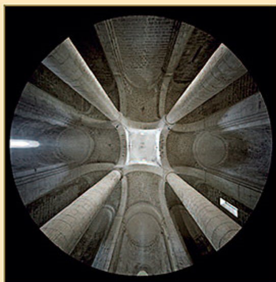
ABBAZIA DI SAN VITTORE ALLE CHIESE (SAN VITTORE TERME PRESSO GENOVA, ANCONA)