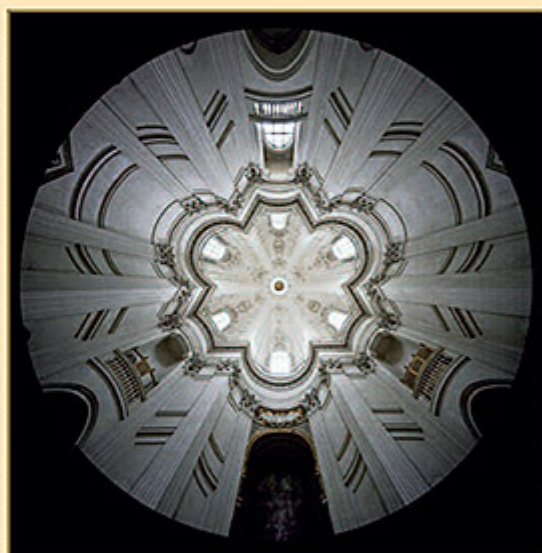
CHIESA DI SAN CARLO ALLE QUATTRO FONTANE (ROMA)