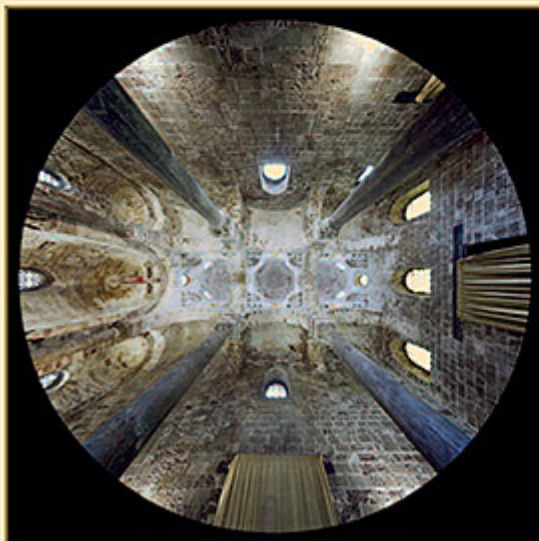
CHIESA DI SAN CATALDO (PALERMO)