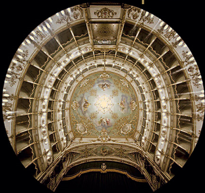
TEATRO COMUNALE DI CASPI (CASPI, MODONA)