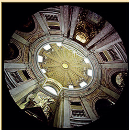
CHIESA DI SANT'ANDREA AL QUIRINALE (ROMA)